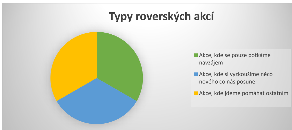
Graf 1 Typy roverských akcí

Práce s rovery a rangers má ve skautské výchovné metodě stejné místo jako všechny ostatní. Stejně jako u skautů je i toto důležitý věk pro osobní rozvoj. Zároveň se zde čím dál více začíná objevovat prostor pro působení navenek. V roverském kmenu už si nemusíme tolik „hrát“ jako tomu bylo u vlčat, světlušek, skautů či skautek. Právě proto by zde mělo mít místo uplatňování 2. principu.